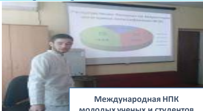
Международная НПК молодых ученых и студентов